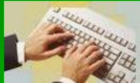
Procesamiento electrónico de datos